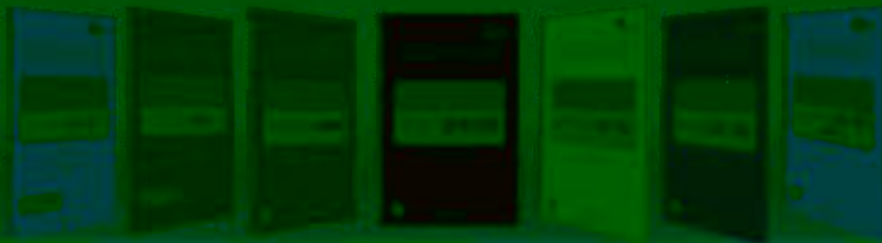
一体化课程教学设计 综合实训基地